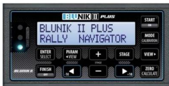
Blunik I, Blunik II, Blunik II+